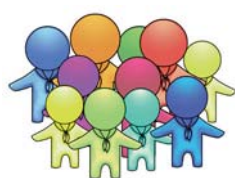
Pfadfinderarbeit in Diözesanverbänden