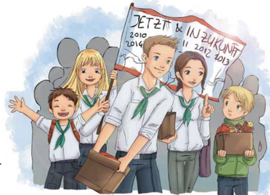
Pfadfinderarbeit Jetzt und in Zukunft

Zinsen sind der Preis von Geld. ... Zinsen. Genau genommen ist es der Preis, den jemand zahlen muss, der sich Geld leiht. Andersherum geht das natürlich auch: Jemand verleiht Geld. Legen wir also unser Geld bei der Bank an, zahlt die Bank uns dafür Zinsen. Genau das machen Stiftungen. Sie sammeln Geld und die Bank packt Jahr für Jahr Zinsen drauf.