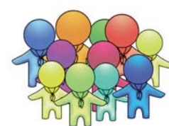
Pfadfinderarbeit in Diözesanverbänden