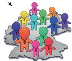
Pfadfinderarbeit im Bundesverband