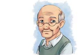
Opa spendet zusätzlich